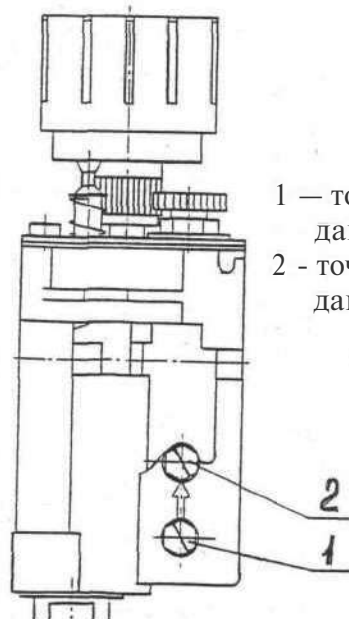
Рис. 4. Точки проверки входного и выходного давления газа.