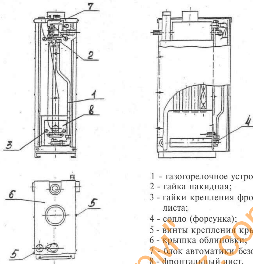
Рис. 1. Конструкция аппарата (на виде спереди съемная панель условно не показана)